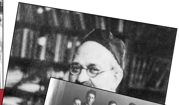
Membri del movimento sionista polacco