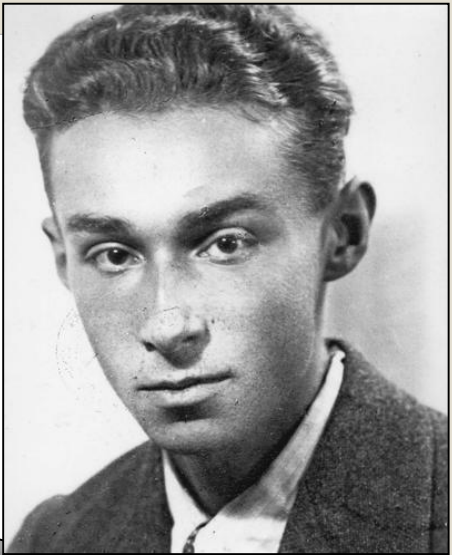
Primo Levi Torino