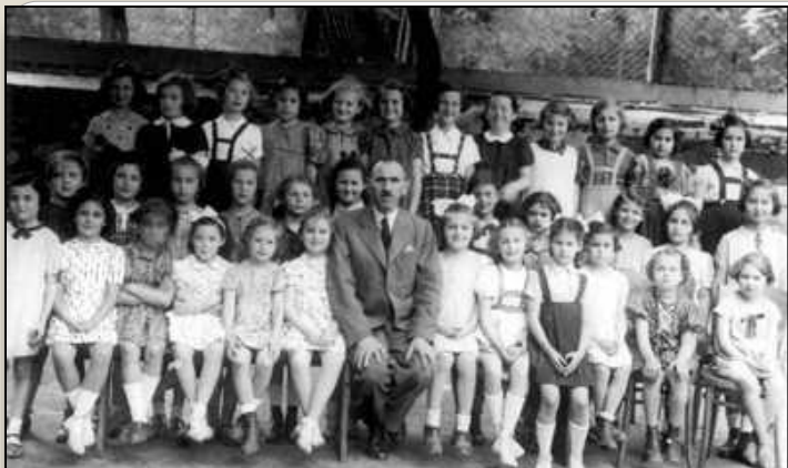
Allievi scuola ebraica in Cecoslovacchia.