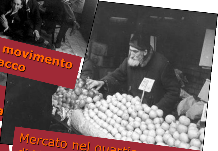
Mercato nel quartiere ebraico di Varsavia